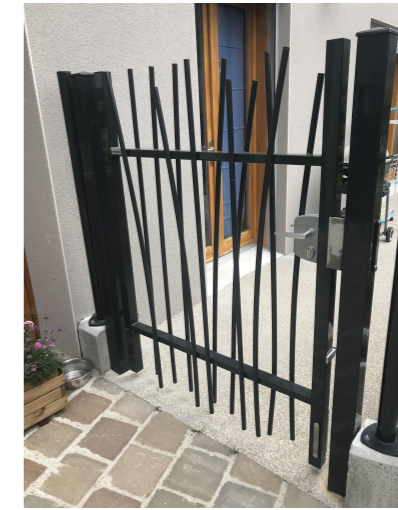
1.2.5.13 - Portillon métallique