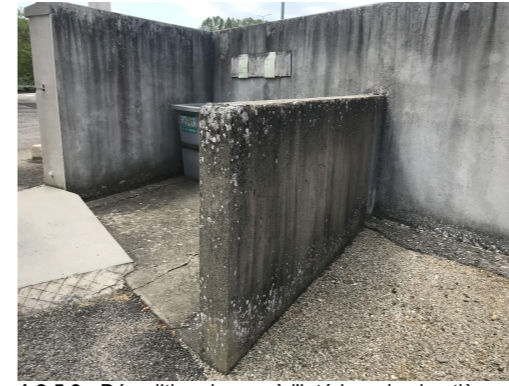
1.2.5.3 - Démolition du mur à l'intérieur du cimetière