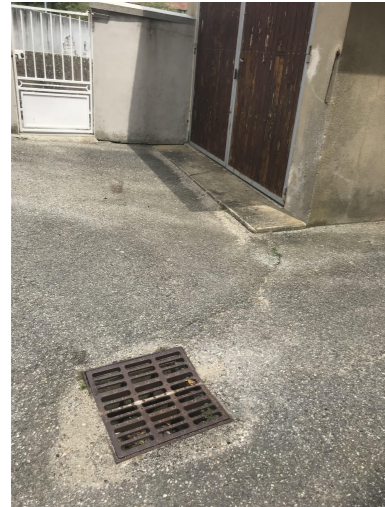
1.2.5.4 - Découpe d'enrobés 1.2.5.5 - Démolition d'enrobés 1.2.5.7 - Couche de réglage 1.2.5.8 - Enrobés avec forme de pente