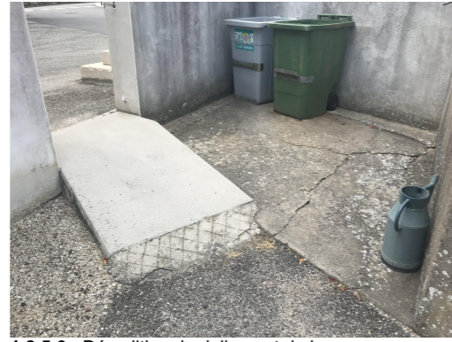
1.2.5.6 - Démolition du dallage et de la rampe