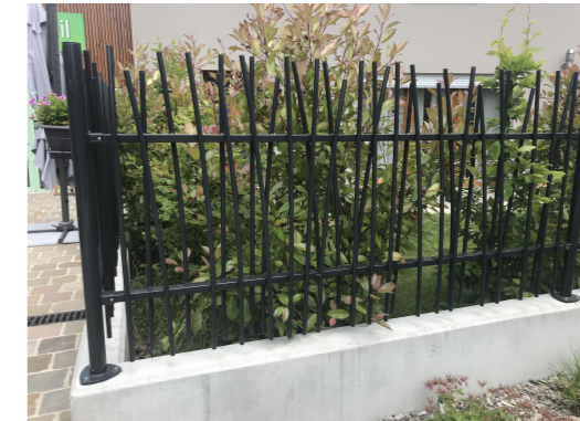
1.2.5.11 - Muret 1.2.5.12 - Grille de clôture