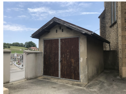
1.2.5.1 - Sciage propre 1.2.5.2 - Déconstruction du hangar, appentis et mur